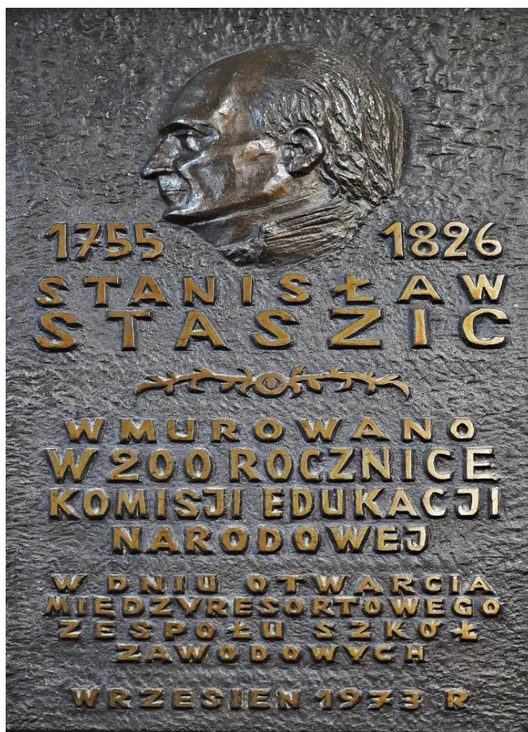
Tablica pamiątkowa wmurowana w 200 Rocznicę Komisji Edukacji Narodowej w dniu otwarcia Międzyresortowego Zespołu Szkół Zawodowych, wrzesień 1973