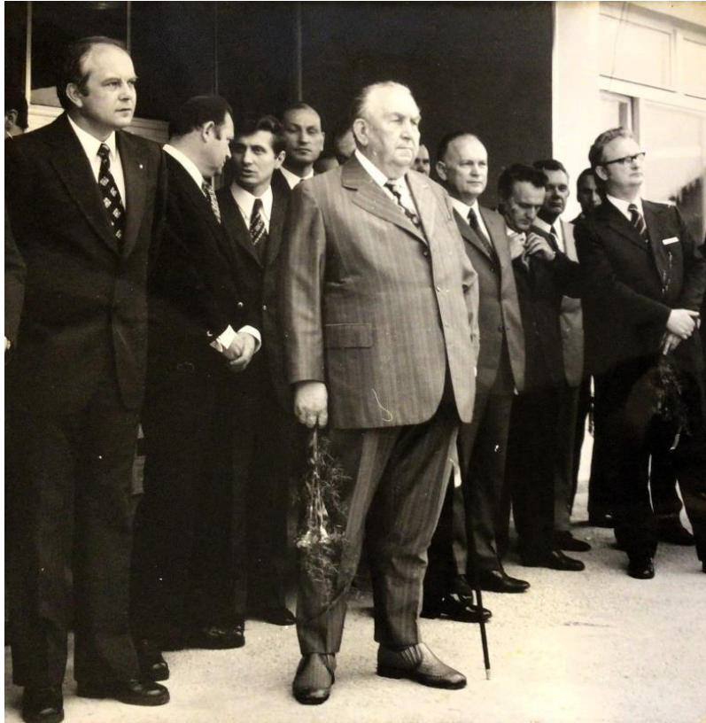
Wojewoda śląski Jerzy Ziętek podczas uroczystości otwarcia szkoły